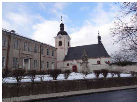
Kostel sv. Václava

Ratboř – Kostel sv. Václava přestavěn barokně r. 1673, v r. 1700 rozšířen. Barokní sousoší Apotheosy z 1. pol. 18. stol. Starý zámek (nepřístupný) vznikl přestavbou barokního zámku (z r. 1723) z pozdně gotické tvrze (z 15. stol.). Přestavbu provedl J. Kotěra v r. 1914; v parku plastika od J. Štursy. Od něho pochází také sochy Nového zámku, který je Kotěrovou secesní stavbou („Chateau Kotěra“, dnes hotel pro polistopadové zbohatlíky) z let 1912-1913.