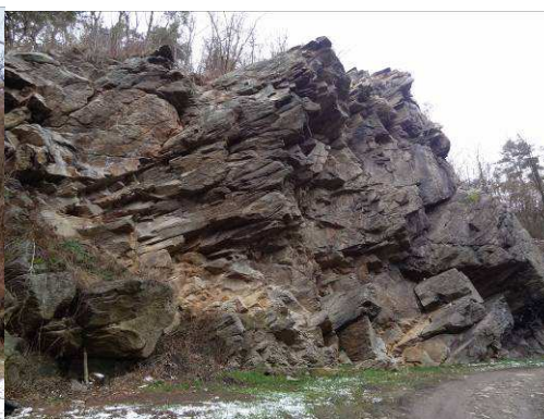
Skála u Kohoutova mlýna